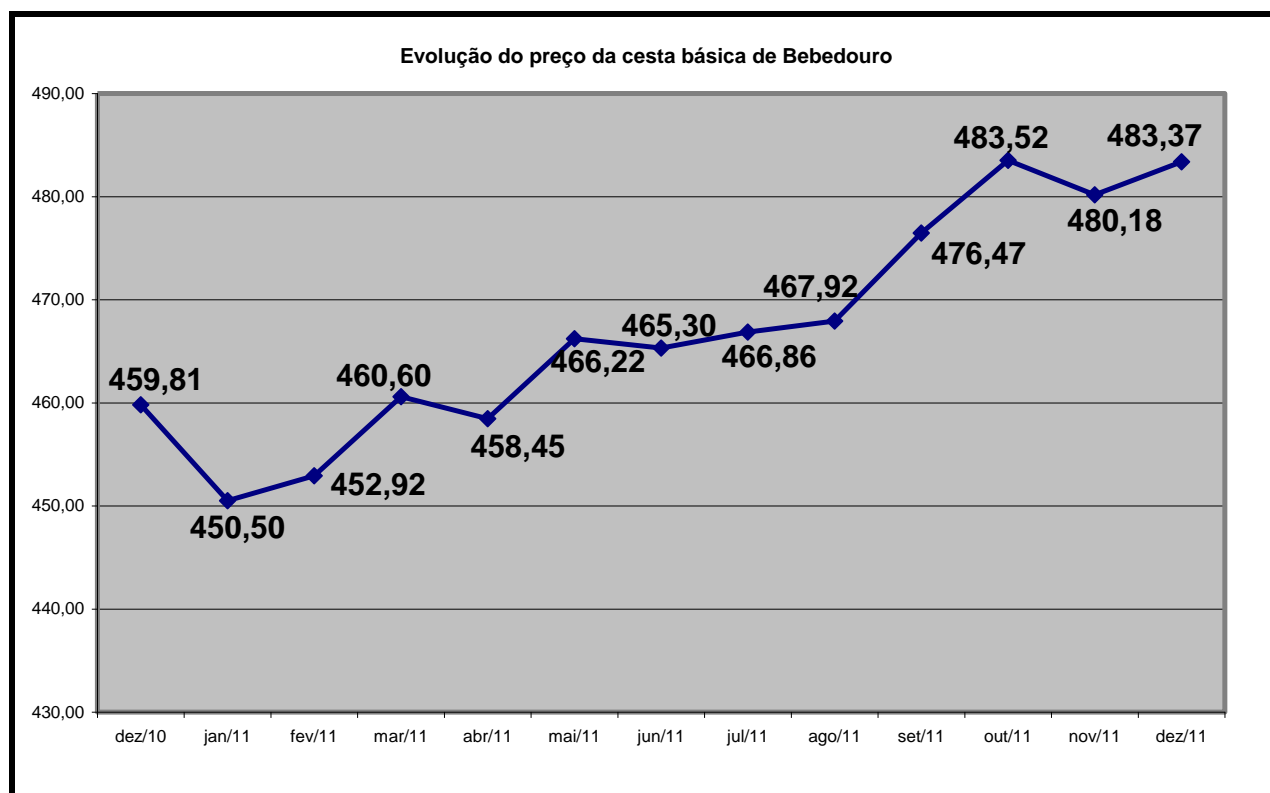
Gráfico 1. Evolução do preço da cesta básica de Bebedouro, 2011

O Gráfico 1 e a Tabela 1 mostram a evolução dos preços da cesta em 2011, em reais. O preço mais baixo da cesta foi em janeiro, quando custava R$ 450,50; e o pico de preço ocorreu em outubro, quando o valor alcançou R$ 483,52.